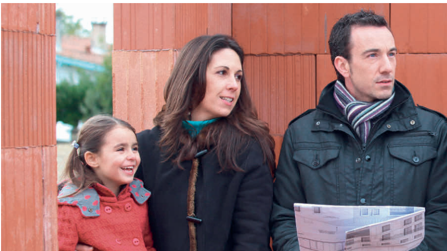
Fällt der Eigenmietwert oder nicht? Die Diskussion ist noch im Gang.

Steuerabzüge (Hypothekarzinsen, Unterhaltskosten u. a.) ebenfalls erhalten bleiben sollen. Im Nationalrat wurde rasch klar, dass der Ansatz, «den Fünfer und das Weggli» zu wollen, nicht mehrheitsfähig ist. Nun geht das Geschäft zurück an die Kommission. Mit raschen Änderungen in Sachen Eigenmietwert ist also vorderhand nicht zu rechnen. ■